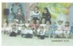
Младшая группа №2