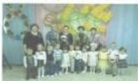
Младшая группа №1

Мероприятие доставило много положительных эмоций зрителям. Все вышли довольные. Но сколько труда вложено в него! Знают только те, кто готовил этот праздник – это воспитатели и воспитанники младшей группы №1, младшая группа №2 и самые маленькие воспитанники «группы раннего развития».