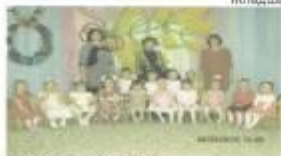
Группа раннего развития